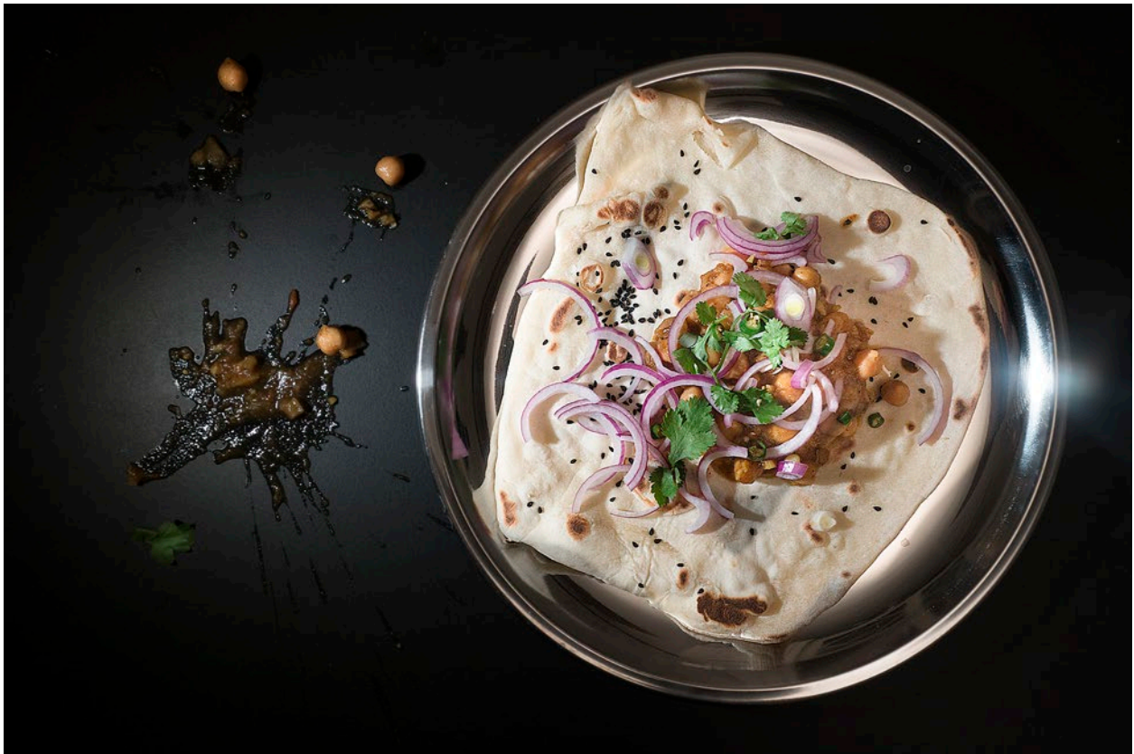
Fladenbrot mit geschmorten Kichererbsen kommt im Punjab seit 5000 Jahren täglich auf den Tisch. (Zürich, 2/2017)