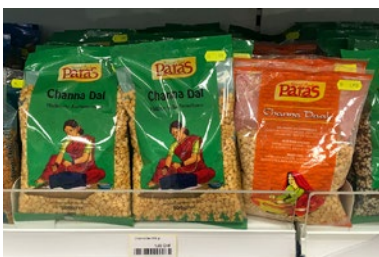
Beide Kichererbsen werden im Handel auch in halbierter Form angeboten, was die Kochzeit deutlich verringert. Allerdings bekommt das fertige Gericht so auch eine ganz andere, stärker breiige Konsistenz.

große Fleischfresser waren: Rind, Büffel, Ziege, Schildkröten und Krokodile (Gaviale) standen auf dem Speiseplan. 6 Die wichtigste Ernährung aber dürften Getreide und Hülsenfrüchte gewesen sein. Weizen, Gerste und wohl auch Hirse wurden gemahlen, mit Flüssigkeit zu einem Teig verarbeitet, zu Fladen geformt und entweder auf einer Platte aus Metall oder Lehm gebraten, die der modernen Tava ähnlich sah – oder in einem irdenen Ofen gebacken, der dem heutigen Tandoor glich. 7 Die Speisen dürften mit Gewürzen wie Senf, Bockshornklee, Kurkuma und Ingwer aromatisiert worden sein, die man auf handlichen Malsteinen zerkleinerte, wie sie heute noch in ländlichen Gegenden gang und gäbe sind. 8 Öl gewann man aus Sesam und Senf. 9 Hülsenfrüchte wurden oft gemahlen und zu kleinen Kuchen verarbeitet. 10 In den Küchen der Harappa-Zivilisation gab es aber auch diverse Töpfe, in denen Getreide und Leguminosen im Ganzen gekocht werden konnten.