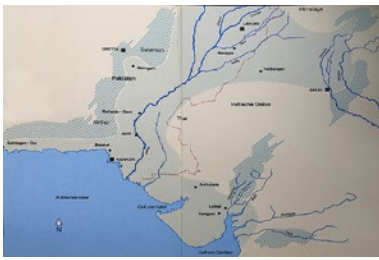
Das Verbreitungsgebiet der Harappa-Kultur. (Bild aus Michael Jansen: Die Indus-Zivilisation. Wiederentdeckung einer frühen Hochkultur . Köln: DuMont Verlag, 1986.)