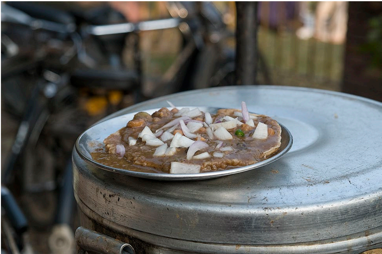
Chole wird meist mit rohen Zwiebeln, Korianderkraut und grünem Chili serviert. Gelegentlich wird das Gericht auch mit Zitronensaft gesäuert oder mit einer sauer-süßlichen Sauce aus Tamarinde und Zucker abgeschmeckt. (Amritsar, 12/2017)

nehmen. Diese Erbsen haben eine festere Textur, eine dickere Schale und einen kräftigeren, erdigen und nussigen Geschmack. Sie heißen Chana (चना) oder Kala chana («schwarze Kichererbsen») und werden im Handel auch in halbierten Form angeboten, meist unter dem Namen Chana dal . Das hier vorgestellte Gericht wurde während Jahrhunderten mit dieser kleineren Kichererbse gekocht, heute verwendet man im Punjab aber meist die größeren Kabuli chana .