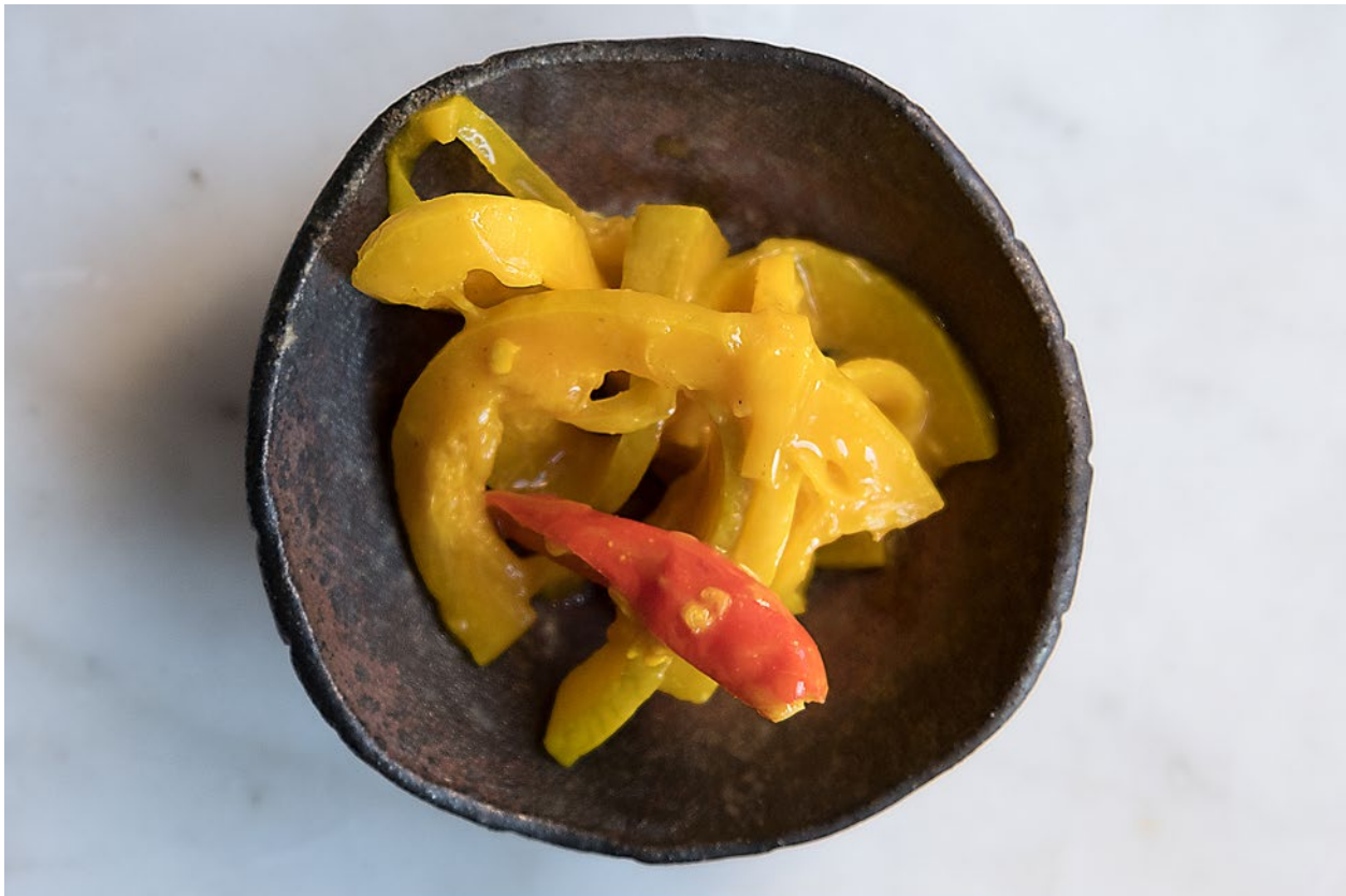
Ein Pickle nach dem Vorbild des Achard von Claude Jolicœur aus Roche bon dieu auf der Insel Rodrigues. (12/2016)